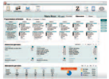
Il software per la terapia alimentare.